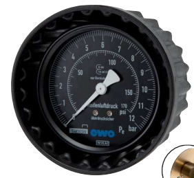
Typ HRFG MANO