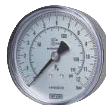
Typ HRFGS MANO