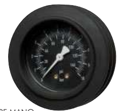
Typ HRF MANO