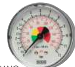
Typ HRFS MANO